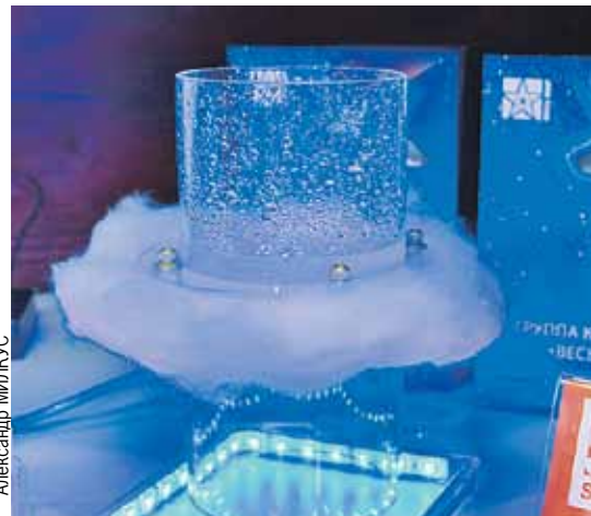
Новый отечественный утеплитель «Шелтер» - тонкий и надежный - сегодня используют для изготовления outdoor-курток.

Подготовили Елена БАБИЧЕВА и Евгений СТРИГУНОВ.