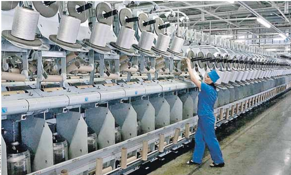
На наших ткацких фабриках сегодня стоит самое современное оборудование.

кожа и обувь (TCLF: Textiles, clothing, leather and footwear) и используют сегментацию, основанную на областях применения конечной продукции. Поэтому трудно сопоставлять показатели российского легпрома со, скажем, странами Евросоюза. Выходом может стать гармонизация подотраслей по мировому образцу, чей подход не только полностью покрывает существующую в России классификацию, но, главное, дает возможность охватить сегменты, которые минимально представлены, а также позволяет анализировать каждый этап цепочки создания стоимости. Но если такое новшество интересует больше специалистов, то потребителям будет любопытно другое. Важным шагом на встречу потребителю можно считать появление российско-