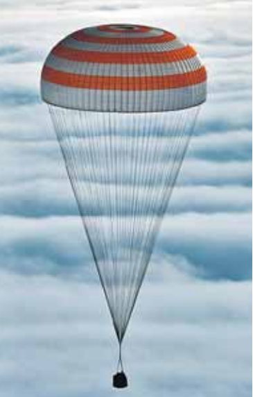
Параюты для космических кораблей - это тоже продукция легпрома.

- Вискоза - хит международного рынка на протяжении по-